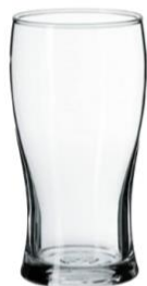
1 verre transparent

Ce document fait partie de la mission atomos disponible sur le site www.mifizi.fr